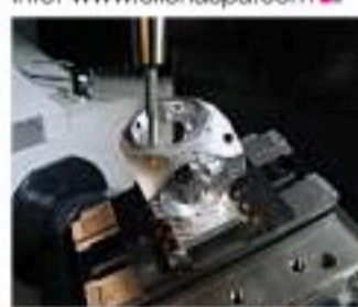
Finitura meccanica su grezzo in Additive

Ellena SpA è un'azienda nata nel 1944 che conta oggi circa settanta dipendenti. È specializzata nella lavorazione di precisione su macchine utensili ad asportazione trucioli e nell'industrializzazione, progettazione, montaggio e test di gruppi meccanici, pneumatici e oleodinamici. Oggi l'azienda non è più soltanto una semplice esecutrice di lavori, ma si è trasformata in service provider, una fornitrice di servizi a 360 gradi per player mondiali in settori complessi oil&gas e aerospace. Dal 2015, Ellena è entrata con successo anche nel mondo dell'additive manufacturing. Info: www.ellenaspa.com